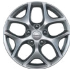
חישוקי 17" ברמת גימור Touring L חישוקי 18" ברמת גימור limited